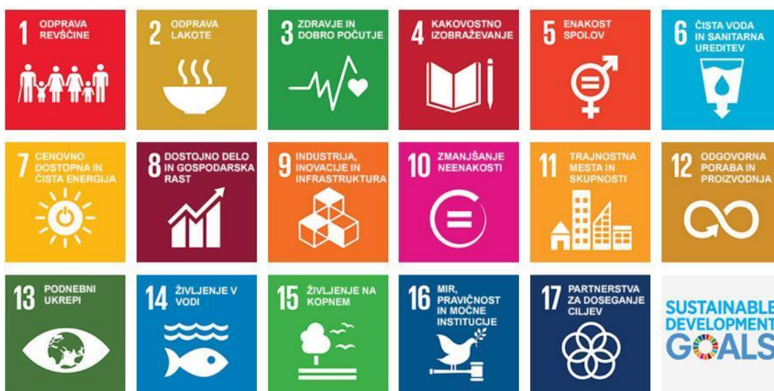
Slika 2: Sustainable development goals ( https://www.un.org/sustainabledevelopment/sustainable-development-goals/ ) oz. Kazalniki ciljev trajnostnega razvoja (Statistični urad RS https://www.stat.si/Pages/cilji )

Znani so tudi kot globalni cilji, ki so jih leta 2015 sprejele vse države članice Združenih narodov kot splošen poziv k ukrepanju za odpravo revščine, zaščito planeta in zagotovitev, da bodo ljudje do leta 2030 (Agenda 2030) uživali mir in blaginjo.